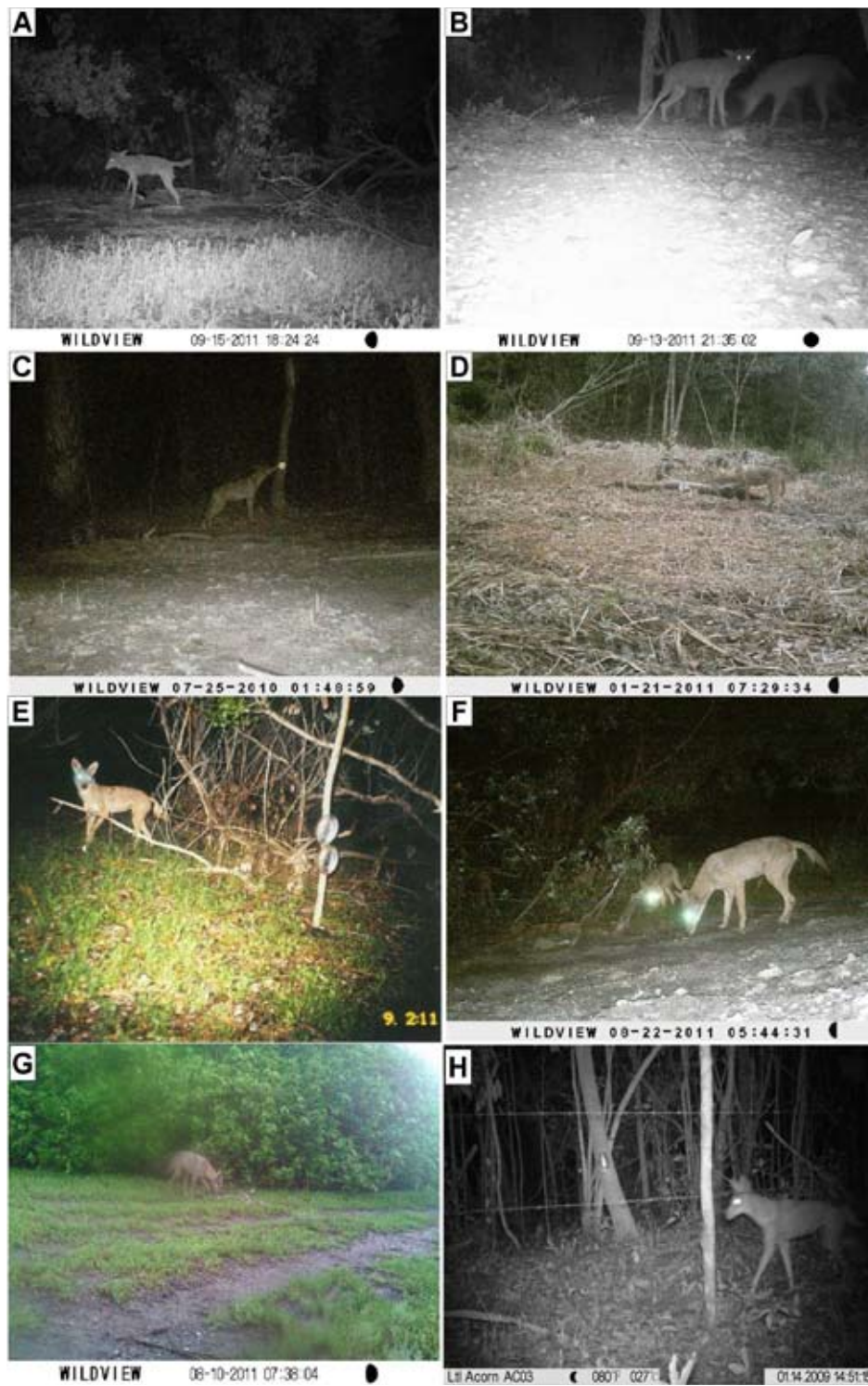
Figura 2. Fotografías de algunos de los coyotes registrados en el oeste de Campeche entre 2009 y 2012. A, coyote solitario en Atasta, Campeche; B, fotografía de pareja de coyotes al parecer adultos en Atasta, Campeche; C, coyote solitario en los alrededores del arroyo Las Piñas; D, coyote solitario fotografiado en la región del Río del Este; E, coyote solitario fotografiado en el ejido Manantiales; F, dos coyotes (al parecer adulto y cría) fotografiados en la región de Sabancuy; G, coyote solitario fotografiado en la región de Sabancuy; H, coyote solitario fotografiado en acahuales del ejido San Pablo Pixtún.